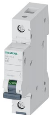
小型断路器 230/400V 10kA, 1极, B, 10A